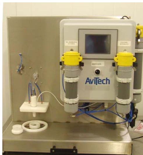
Figura 1. Máquina Intellilab®. Este modelo injeta um ovo de cada vez, sendo uma versão de pequena escala do modelo comercial da Avitech's Intelliject®.

Todos os ovos foram incubados juntos e nos dias 24 (grupo D24) ou 25 (grupo D25), os ovos foram removidos da incubadora e furados com a agulha de injeção in ovo . Em seguida os ovos foram retornados à incubadora. As injeções foram realizadas com uma máquina Intellilab® de laboratório de pequena escala produzida pela Avitech (esta máquina de $15.000 foi doada ao laboratório da Dra. Fasenko pela Avitech). Nenhuma substância foi injetada nos ovos. A agulha foi introduzida 0,5cm dentro do ovo e o diâmetro do furo criado pela agulha foi de 1,3mm.